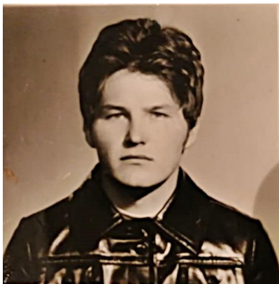
a leszerelés után egy héttel.

Kemény, de igazságos tiszt volt. Néhány évvel volt csak öregebb tőlünk akkoriban végzett az akadémián. Kb. 25 év elteltével egy rádióriport kapcsán találkoztunk („nagy egymásba borulás volt”), most nyugállományú ezredes.