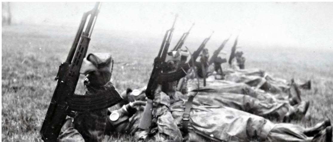
Légítámadás elhárítása szennyezett terepen

Az első hat hónapban a híradó szakaszban híradó (rádiórelé) kiképzést kaptam - azért az kemény volt, tévedni nem lehetett -, illetve minden más kiképzést is megkaptam.